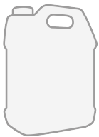
Jerrican plastique de 5