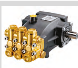
Pompa a pistoni in ceramica Ceramic plunger pumps TNM