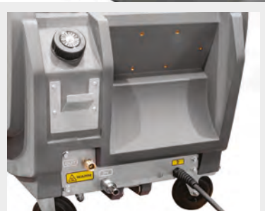
Dettaglio ingresso/uscita Inlet and Outlet