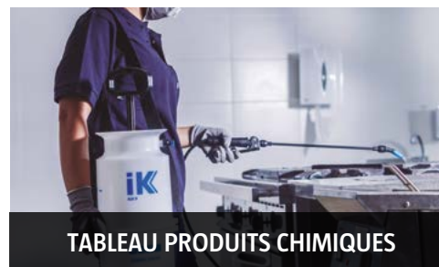
TABLEAU PRODUITS CHIMIQUES